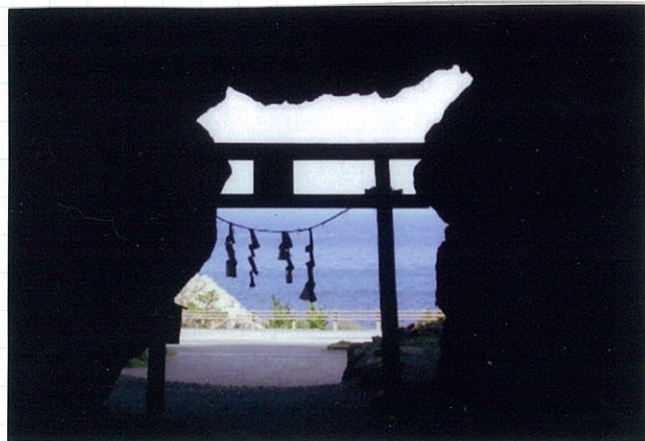
御厨人窟から見た「空」と「海」

「第2回お遍路の旅」は弘濟寺檀信徒団体参拝旅行。第18番から第37番までをお参りする予定ですが、予定の中心にはお参りできない方もあります。お大師様が修行されたお大師様御厨人窟の先端に輝く洞窟の明窓が有名です。この洞窟は、開いたとき、星がキラキラと見える有名な場所です。空の美しさ、海の色、洞窟の入り口、お大師様の修行の跡、お大師様の御厨人窟の先端に輝く洞窟の明窓が有名です。空の美しさ、海の色、洞窟の入り口、お大師様の修行の跡、お大師様の御厨人窟の先端に輝く洞窟の明窓が有名です。