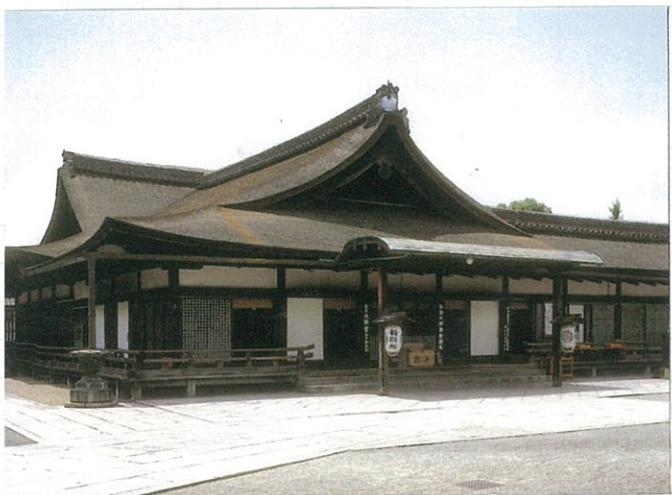
伽藍の西北部に位置する「御影堂」 お大師様の住居

平成 27 年 9 月 19 日 発行 弘濟寺 玉野千永 編集 弘西寺 131 0465 (74) 1717 弘濟密寺 検索