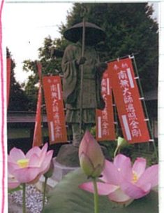
開本のか藤にお花が 頂いた。お大師様の御影が 深まってきた。毎年植替えをお手伝い 頂く。藤福寺にお花を Thank you

正右に五重塔が見えます。その塔の周りには、お大師様の御影が祀られています。御影堂の裏には、お大師様の御影を拝見するための御影堂があり、お大師様の御影を拝見することができます。