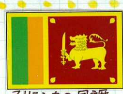
スリランカの国旗

は仏笑 教、度 家徒てを彼 30ら暑 ま度はい気 にとの温少て がま設てではしい 家し定も、27小 のたし寒日てさし に度島。ロド、 の思ス福然な校 に房し、道呼し、 のた年平よば下、 温、中均りれに、