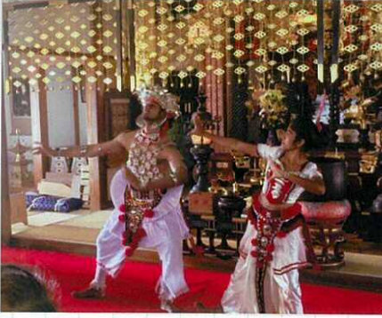
「キャンディダンスを披露するナヨット君」

スリランカでは、お寺を参拝する時、ま 仏舎利塔、次に菩提樹、そして仏像を お参りするそうびす。お釈迦様はインドの ブッダガヤの菩提樹の木の下の下で悟りを 開かれましたが、その分け木が「スリランカに 植えられ、2000年以上たった今も生き続 けているそうびす。凄いであわ。インド菩提樹 の木は日本ではあまりみられませんが、実は 弘濟寺でも見られる場所があるんびすよ。