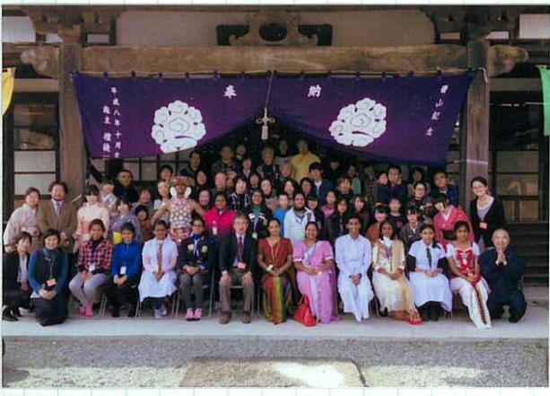
「スリランカ歓迎会時集合写真」於弘濟寺

蓮 蓮の 植替えをしました。 苗が余分にありまるのび 育てたい方は声を かけて下さい