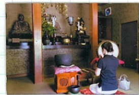
興福院弘法堂で 手を合わせる筆者

に変わってはいま、山あがり お堂の中は、山あがり お堂の中は、山あがり お堂の中は、山あがり