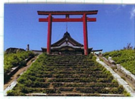
周囲には何もなく 神々しい元宮

江戸時代までの神仏習合から明治時 代の廃仏毀釈によって真言宗の多くの 名刹が姿を消しました。途中下車ぶら り詣りが2回目です。箱根権現(※1)に源頼 朝に篤く信仰された箱根権現(※1)に源頼 朝に篤く信仰された箱根権現(※1)に源頼 朝に篤く信仰された箱根権現(※1)に源頼