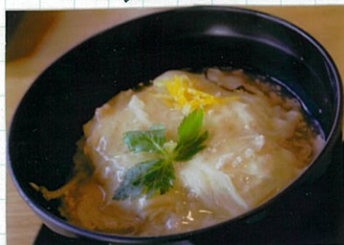
● 湯葉丼 ●

箱根神社入口バス停から徒歩1分「あしこの茶屋」の 湯葉丼。お店は海賊船も見えろ眺めのいい所にあり ます。あつあつのご飯にトロトロの湯葉。優しい お味でパロリと食べれちゃう。ちょっと物足りなかいかな？ と思ったら1階に降りて、「縁結び焼」はいかが？ 可愛いハート型の大判焼きです。お味は小倉。小倉4-ズ アップルジャムカスタード、抹茶クリームぜんざいの4種類。 私は小倉4-ズを食べましたが、4-ズと小倉って しょっぱくて甘い感じが合うんですね。焼きたてをワトの パンで食べるのがお薦め♡