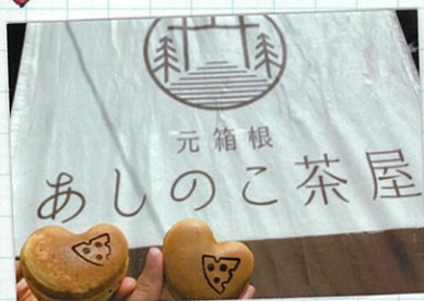
● 縁結び焼 ●