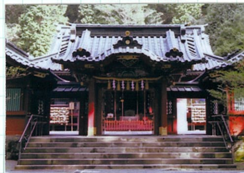
箱根権現 金剛院 東福寺

江戸時代までの神仏習合から明治時 代の廃仏毀釈によって真言宗の多くの 名刹が姿を消しました。途中下車ぶら り詣りが2回目です。箱根権現(※1)に源頼 朝に篤く信仰された箱根権現(※1)に源頼 朝に篤く信仰された箱根権現(※1)に源頼 朝に篤く信仰された箱根権現(※1)に源頼