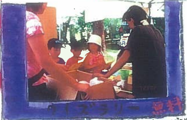
アイスを食べるとお菓子がもらえるアイスラリー

手伝いにかけてつけてくれた中学生のなげまちは、あやふさな売り場さ。この暑さでかき氷の売れ行きはすごいです。