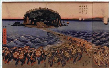
歌川広重の江島参詣群集え図