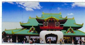
片瀬江島馬の完成予想図!!

今回は小田急線片瀬江島駅で下車し、このからの季節賑わう江島神社にお詣りしました。江島は東京2020オリンピックの会場に選ばれた。江島は東京2020オリンピックの会場に選ばれた。江島は東京2020オリンピックの会場に選ばれた。