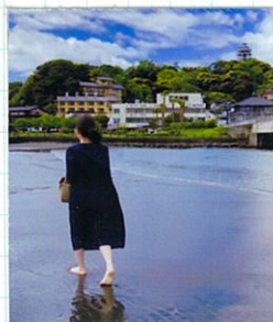
橋の下の海を歩いて渡り筆者この現象「トンボロ」というそうぞう。