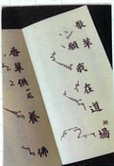
声明の楽譜 五線譜ではなく こんは風に ちよと変わった 音譜です。