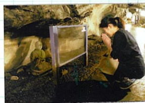
岩屋の中の大師像前にて

青銅の鳥居をくぐり、階段を登った先に、日本三大天宮に数えられる江島神社。江島神社は、江島に鎮座する。江島神社は、江島に鎮座する。