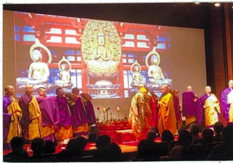
東博での声明公演のステージ

応募の中にはこちらの想定外の「ニカニカ」や 「ガランガラン」などの答えがあり驚かせて頂きました。 お寺は「ものを手に持つことを表す」と音と表す 「え」でできた「キク」声文字「本来は「もつ」ことを意味 する漢字だったそうです。 これからも希望をいかり持って楽しくありがたい お寺として参らざりていきたいと思っております。