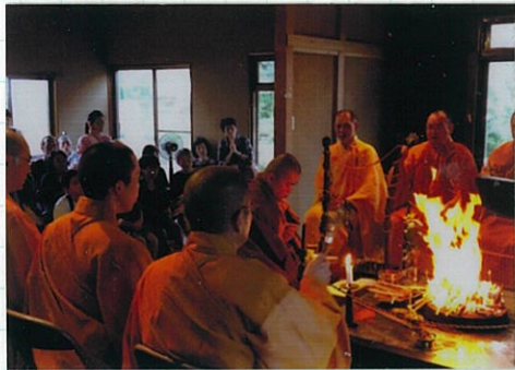
「いん佳が初めて護摩師を務めました」