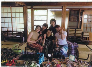
「毎年かわいい手作り小物を出品してくれるフリーマーケット仲間」

7月23日第21回地蔵まつりを開催しました。今年の梅雨は長く、梅雨明けならず…。おまけに当日の予報は雷雨。心配していましたが雨も雷も無く開催できて良かったです。