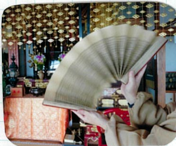
ひんじく これは「 転読 」というお経の読み方