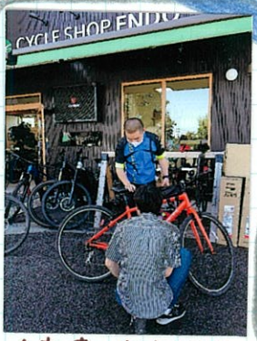
自転車の1年点検が寄りました。いつも親切に丁寧みてくれます!!

住 お師匠様？ 「ええ、私の師匠は、お寺の事を可 も知らなかつた私に キャバツを5個育てて と言、た人です。お寺でキャバツの お寺に入るまで畑なんぞ した事無いので、か わからず育ててみると、キャバツは 青虫に食べられてしまつたり なかな大きくなること 大変なんです。結果5個のうち