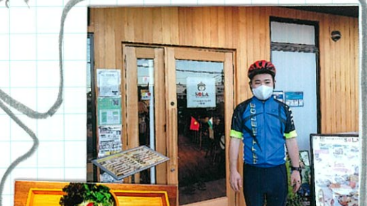
落ちついた店内でメニューも豊富!! おすすめです