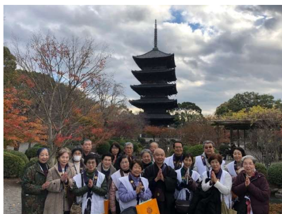
平成30年12月東寺参拝時五重塔前で檀信徒のみなさんと記念撮影

是非ともこの記念すべき年に真言宗 誕生のご本山 東寺 へご参拝ください。100年に1度の祝賀の年を一緒にお祝いしましょう。