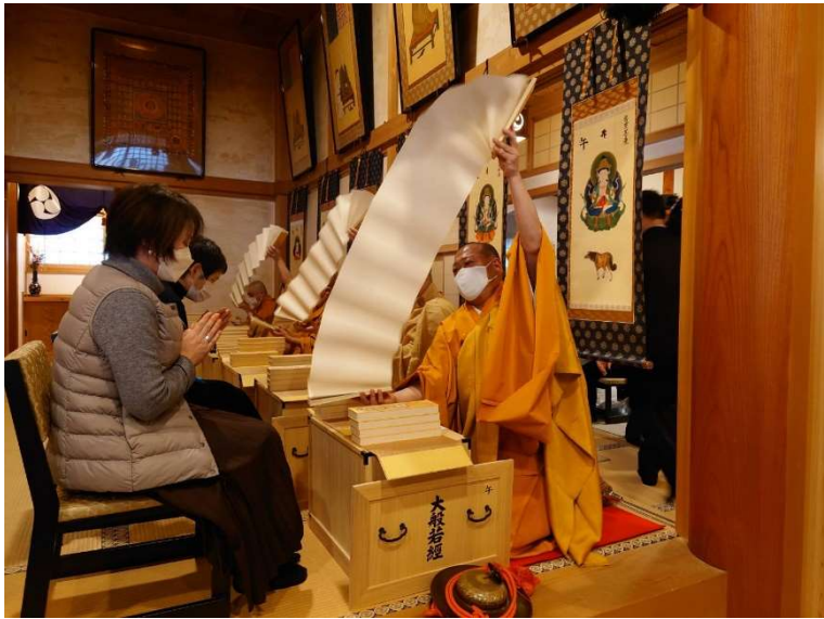
転読法要の様相 (神戸 西代寺にて)

三蔵法師が持ち帰った大量の経典のうち「大般若経」は巻物の経本で600巻。本来経典は、読み上げる（読経）ものですので、1巻を声に出して読み上げると、およそ1時間かかります。600巻全てを読み上げるには150日間飲みます。600巻の状態がようやく完了ということになります。それでは時間がかかりすぎますので、奈良時代に時間を短縮して、経題と御真言だけ