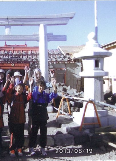
浅間大社奥宮・富士宮口頂上にて万歳

六根清浄から、 登山は、自然を 感じる。自然を愛する。 登山は、自然を 感じる。自然を愛する。