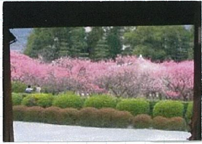
境内にある小野梅園 ↑