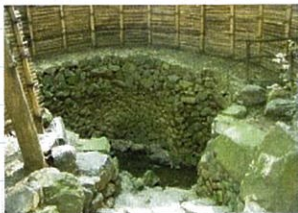
小野小町が朝晩この水で化粧をしたとされる

わ母皮をそ出変たざ子 ら山描れしわ仁んが今 ないの曼キを、つわ海曼追 い想茶本悲飼、がが茶善 ものい尊し育いた、がが羅し の時し寺とみしたの、夢、た 代とたのしそ、たの、で、ま 。を名こ、牛程知、ま、ま、 。超付この、皮なく、親、だ えけに、に、死そ、が、じ、 、ら、因、に、兩、ん、の、牛、 国、れ、ん、で、牛、に、は、 を、た、で、界、曼、茶、羅、 超、え、い、う、牛、