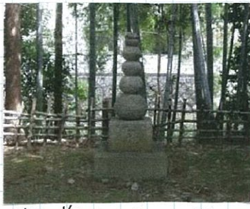
絶世の美女にあつられた沢山の密文を埋めた文塚

がやしたおた大美 で「た寺、美 き文とで、人 ま塚、い、小、の す、う、野、小、一 、も、化、小、町、人 観粧、の、が、ゆ、と る、の、が、か、い、 こ、井、使、り、わ、 と、戸、用、の、水、