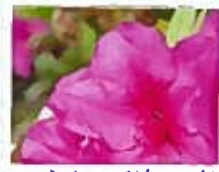
弘濟寺水屋前のつばき。開花時期は4月から5月にかけて、葉はつばきより大きいです。つばきは、葉はつばきと呼ばれています。

花の葉と色もきれいなつばき。つばきは、開花時期は4月から5月にかけて、葉はつばきより大きく、花はつばきより大きいです。つばきは、葉はつばきと呼ばれています。