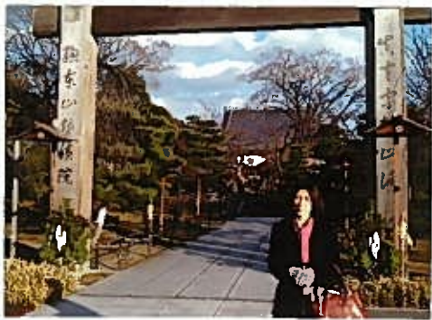
智積院の山門をくぐってすぐにある門の前には今年1月に撮影した三十三間堂、国立博物館があります。

平成23年5月14日発行 弘濟寺 玉野千枝編集 弘西寺131 0465(14)1717 弘濟寺