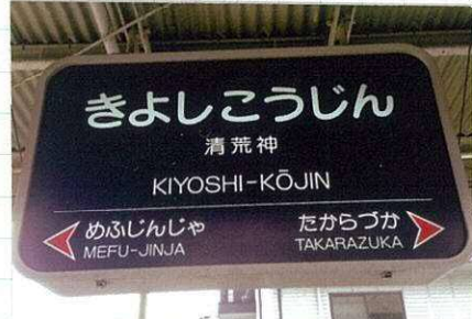
『阪急電車 清荒神駅』

清荒神の神祭りの神火納め所。お祭りに火納めをする。お祭りの神火納め所。お祭りに火納めをする。お祭りの神火納め所。お祭りに火納めをする。