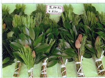
『荒神松』と呼ばれる独特の 取り合わせの香花 3つの松は、三寶を表す

お祭りの神火納め所。お祭りに火納めをする。お祭りの神火納め所。お祭りに火納めをする。お祭りの神火納め所。お祭りに火納めをする。