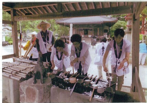
身体を清めるのもお水に!!

さて、次回ですが、開創1200年の 記念すべき年にもう一度参拝したい!! ということで『第2回お遍路の旅』を 11月に企画しました。 初めての方も、檀信徒以外の人も お一人でも是非この機会にご参加 お待ちしております。