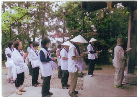
みんな揃って読経